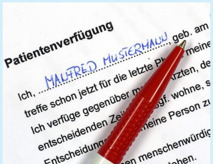
Nur jeder zweite über 60-Jährige hat nach Schätzungen eine Patientenverfügung. Zwei Drittel dieser Dokumente sind fehlerhaft formuliert.

Zu vier Themenbereichen muss man hier nach genauer Überlegung (und gegebenenfalls auch einem Beratungsgespräch) ankreuzen, welche Wahl man treffen (oder eben nicht treffen) will. Dazulegen sollte man ein persönlich verfasstes Beiblatt, auf dem noch Detailfragen geklärt werden können (siehe Empfehlungen). Schließlich sollte man das Dokument unterschrieben an einem zugänglichen Ort aufbewahren. Und so sieht es aus: